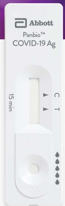
Panbio™ COVID-19 Ag Rapid Test Device